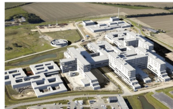
Det Nye Hospital i Vest, DNV Gødstrup