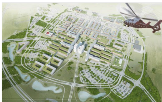
Det Nye Universitetshospital i Aarhus