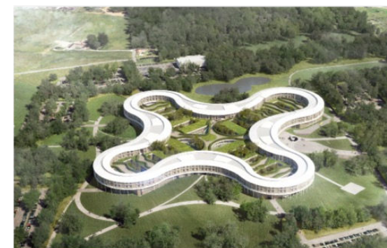
Nyt Hospital Nordsjælland