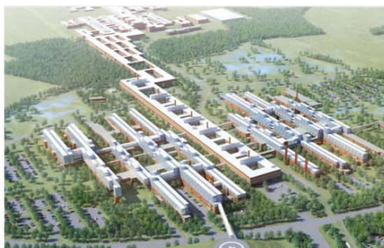
Nyt Universitetshospital i Odense